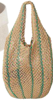
Häkelbag von COS