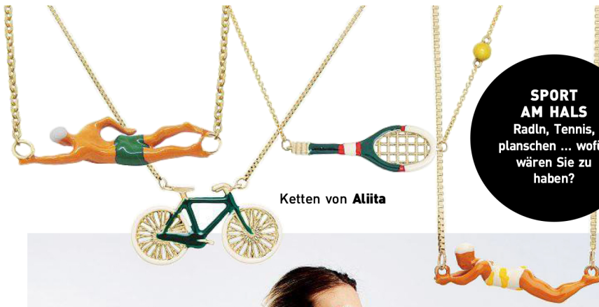
Ketten von Aliita

SPORT AM HALS Radln, Tennis, planschen ... wofür wären Sie zu haben?