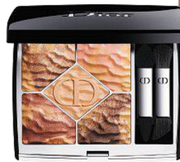
Sommer-Eyeshadowpalette und passender Nagellack „Dune“ von Dior

Passt zu sonnengeküsster und zu blasser Haut.