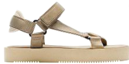
Sandalen von Zara

Von Offwhite bis Sand. Die Palette ist vielfältiger, als man denkt. Sehr schön mit Akzenten in kräftigen Farben.