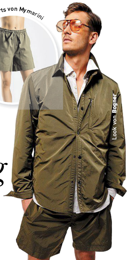
Look von Bogner

Shirts und Shorts, sehr frisch mit einem Splash Weiß.