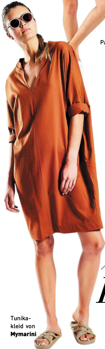
Tunika-kleid von Mymarini