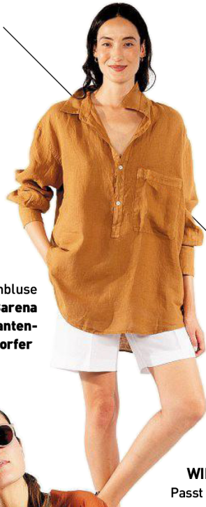
Leinenbluse von Barena bei Dantendorfer