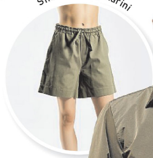
Shorts von Mymarini