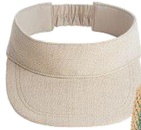
Sonnenschild von Arket