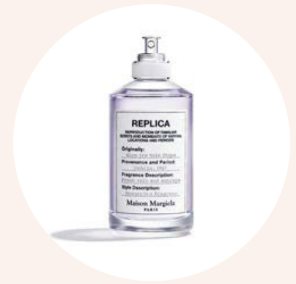
Wenn der Regen aufhört. So duftet das EdT von Maison Margiela Replica. 30 ml ab € 53,-.