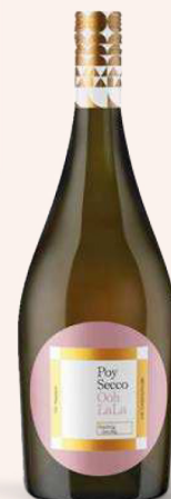
Trinkbar. Prickelnder Poy Secco von anno1555 um € 7,90.

Hamdraht – der neue Gartenkrimi von Martina Parker um € 18,-. Siehe auch Interview auf Seite 40.