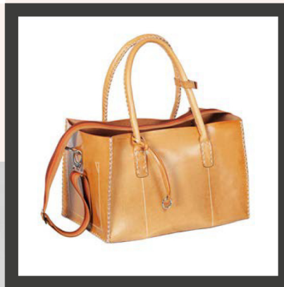
Tragbar. Handgenähte Ledertasche von Hooves um € 1.500,-.