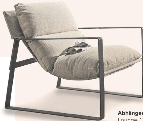
Abhängen. Minimalistischer Lounge-Chair von Loberon um € 298,-.